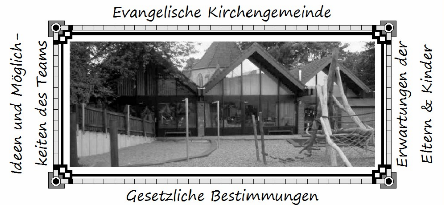
Unsere Kita und ihr Rahmen

Raumgestaltung, Einrichtung, Tagesablauf und Spielmaterial wurden den Bedürfnissen jüngerer Kinder angepasst. Den Dienstplan haben wir hinsichtlich der Aufnahme zweijähriger Kinder so umgestaltet, dass eine durchgehende Betreuung durch eine Bezugsperson weitgehend möglich ist.