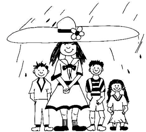
Mehr als nur Kinderhüten?